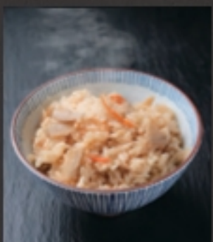
かやくごはん 税込 275円 大盛り + 110円 税込 110円