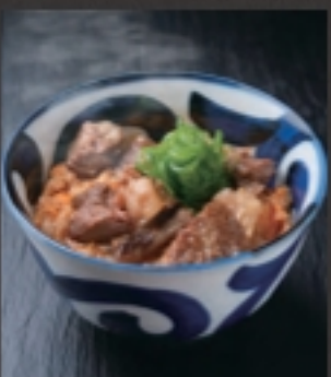
国産牛煮込の肉玉ごはん 税込 539円