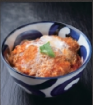
ヒレカツ丼 (小) 税込 649円