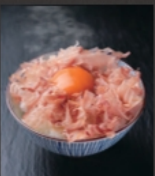
卵かけごはん 税込 275円 大盛り + 110円 税込 110円