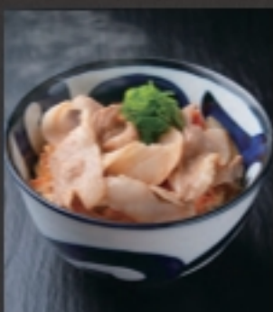
霧島黒豚の肉玉ごはん 税込 429円