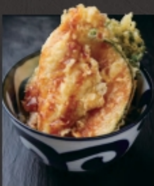
鶏天丼 (小) 税込 583円