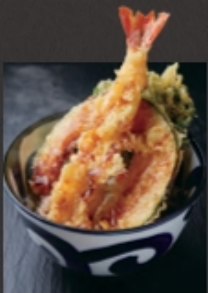
大海老天丼 (小) 税込 649円