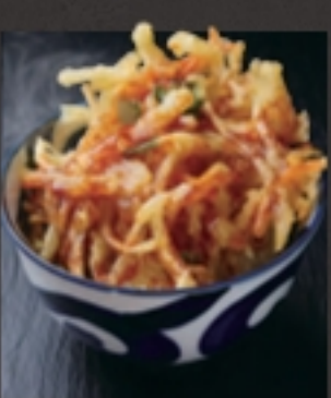
かき揚げ天丼 (小) 税込 429円